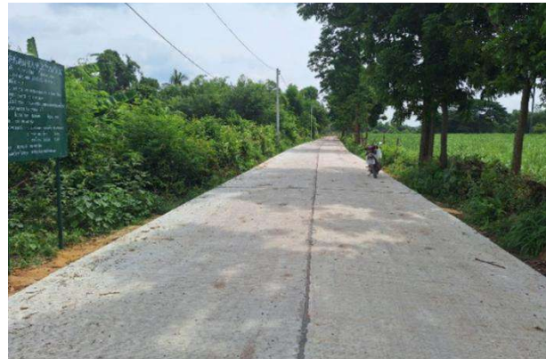
ก่อสร้างถนน คสล. ปากทางบ้านหนองสลักไถ่ถึงท้ายหมู่บ้าน บ้านหนองสลักไถ่ หมู่ที่ 4