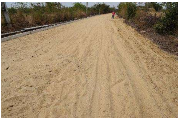
ก่อสร้างถนน คสล. จากสี่แยกต้นแจง - มอเตอร์เวย์ บ้านกุดน้อย หมู่ที่ 1