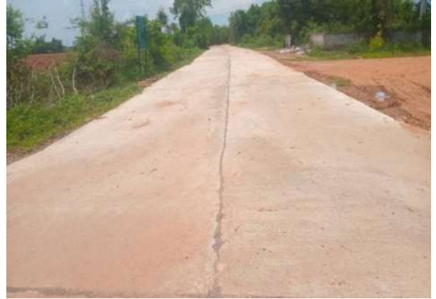
ก่อสร้างถนน คสล. สายทางบ้านโนนเสลา หมู่ที่ 6 - บ้านวังกรด