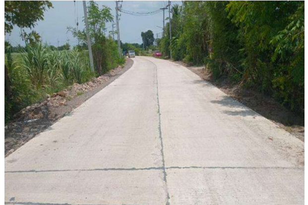
ก่อสร้างถนน คสล. จากบ้านนายอุทัย - สระน้ำประปา บ้านโนนเสลา หมู่ที่ 6