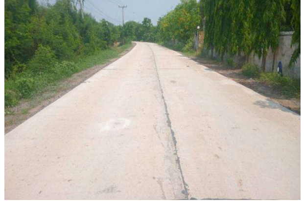
ก่อสร้างถนน คสล. สายบ้านดอนนกเขา หมู่ที่ 5 ถึงตำบลบ้านหัน