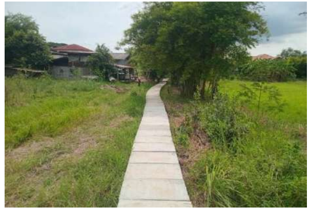
ก่อสร้างถนน คสล. จากปากทางเข้าหมู่บ้าน ถึงบ้านนางพรบ บริเวณสามแยกบ่อหิน บ้านบ่อทอง หมู่ที่ 14