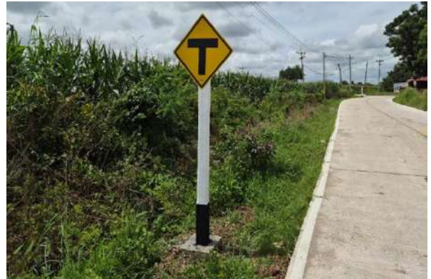
ก่อสร้างถนนหินคลุกบริเวณหลังป่าช้าเก่า บ้านบ่อทอง หมู่ที่ 14