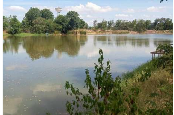
ดำเนินการสูบน้ำเพื่อบรรเทาภัยแล้งขาดแคลนน้ำให้กับประชาชน